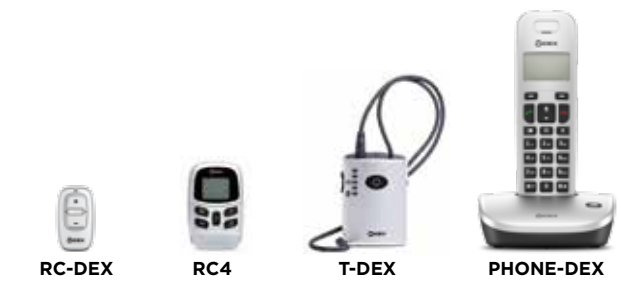
RC-DEX RC4 T-DEX PHONE-DEX